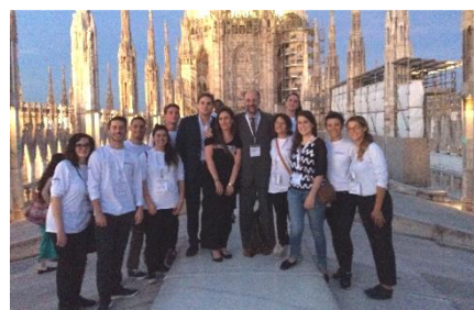
前回ミラノ大会 2016 の学生ボランティア