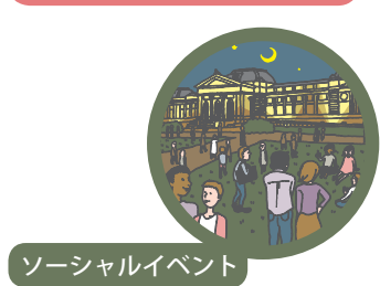
ソーシャルイベント