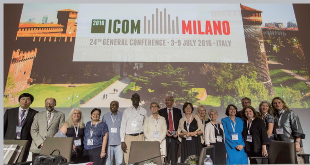
▲2016年ミラノ大会の様子

2019年9月1日(日)～7日(土) | 会場：国立京都国際会館(メイン会場)ほか