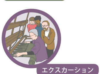
エクスカーション