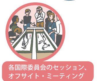
各国国際委員会のセッション、オフサイト・ミーティング