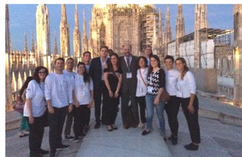
前回ミラノ大会 2016 のボランティアスタッフ