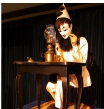
京都嵐山オルゴール博物館